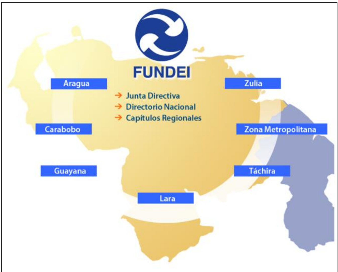
Figura 1 Estructura y alcance de Fundei

Fundei está distribuido a lo largo y ancho de todo el territorio nacional gracias a los Capítulos Regionales con ubicación estratégica. Se encuentran en los principales estados y ciudades del país como: Aragua, Carabobo, Guayana - Oriente, Lara, Táchira, Zona Metropolitana y Zulia.