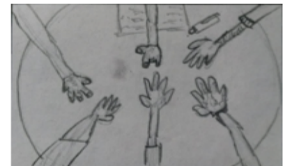
General/ Senital/ Fijo/ despedida de sesión