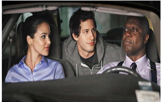
PLANO MEDIO CORTO