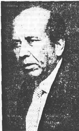
El Presidente no busca una "absurda y aberrante polémica" con Fedecámaras

No me siento orgulloso porque haya ricos en Venezuela. Tampoco lo señalo como repudiable ni pretendo enfrentarlos o vituperarlos. Menos acusarlos de ser los propiciadores de