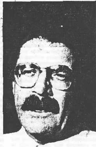
Petkoff: "Congelar el paquete"

Para él, el único que puede resolver la situación es el propio Presidente.