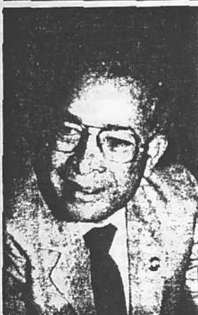
Antonio Ríos: el hampa y la subversión