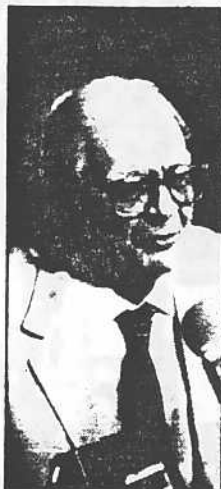
Gonzalo Barrios recibió ayer copia de la “carta de intención”

La alocución que dió el senador vitalicio Rafael Caldera ante la Cámara Alta de ayer, también fue comentada por el presidente de AD: “Fue un discurso concebido con gran altura de miras, como correspon-