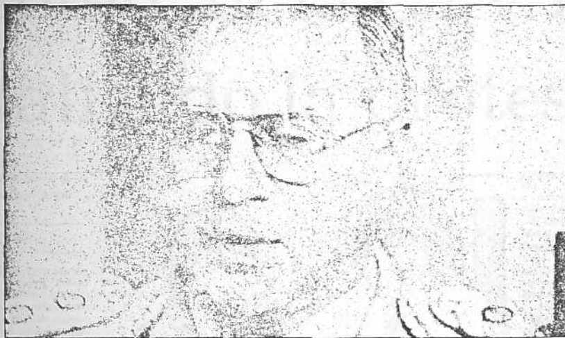
El titular de Defensa, es optimista en que la situación de emergencia en Caracas, puede variar a partir de hoy