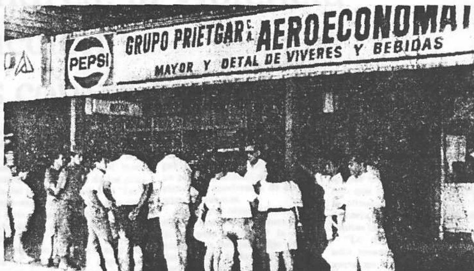
El sector comercial prepara medidas con el gobierno para el abastecimiento de alimentos.

Insistió este dirigente del comercio en que es menester que el gobierno tome las medidas necesarias para garantizar que la gente pueda ir a sus trabajos, para que los autobuseros puedan salir a la calle y que se le dé seguridad a la gente que está en sus casas.