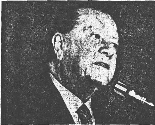
Rafael Caldera la oposición debe cooperar con el Gobierno.

Para quienes lo escuchaban, desde sus curules de senadores, sus palabras eran reconocidas con asentimientos, pero al final hubo quejas en la bancada de AD, porque no hubo la