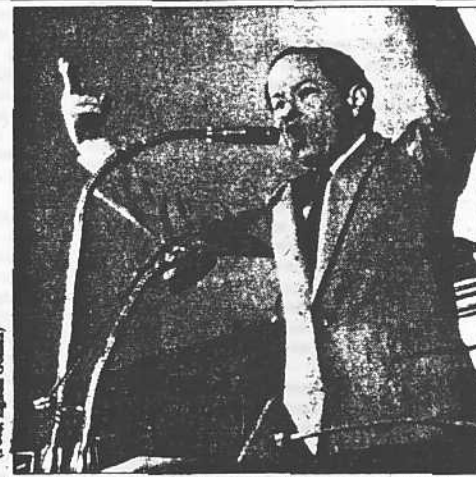
Rodríguez: Tenemos una situación que es responsabilidad compartida y que requiere entendimiento nacional para su solución".

Rodríguez también indicó que en el caso venezolano, dada la característica estructural del sector público, se puede hacer un ajuste con expansión del gasto que no tenga características contractivas, pero lamentablemente, parte del margen de acción se ve disminuido por haber garantizado cartas de crédito a 14,50 en