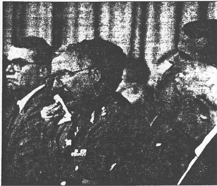
Izaguirre anunció cambio de horarios para todos los lectores.

El ministro de Relaciones Exteriores, Alejandro Izaguirre, ratificó que se mantendrán las medidas de seguridad, para lo cual el horario del sector público estará comprendido entre las 8 a.m. hasta las 2 p.m.