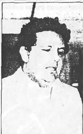
Peña Navas: el descontento social