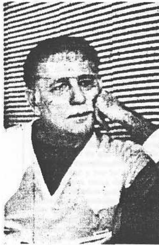
José Vicente Rangel: "Del país de las maravillas al del desastre"

Plantea la tesis de que los Gobiernos venían contando con la pasividad de la gente porque tanto las organizaciones políticas como las sociales, habían creado una cultura de la desmoralización. "Los gobiernos se daban el lujo de hacer lo que le viera en gana sin que se produjera mayores protestas. El Gobierno de CAP, en base a esa tradición elaboró un paquete de medidas pero no se preparó para la reacción que provocarían. Este fue un error importante. El Gobierno calculó mal. Pensó que el tratamiento de shock no despertaría reacciones en base a esa tradición de pasividad".