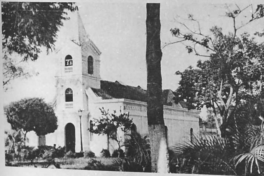
Capilla de N. S. del Carmen (Véase la Pág. 4)