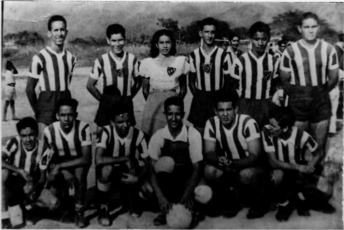
EL VIEJO CORSARIO DEL AÑO 1945