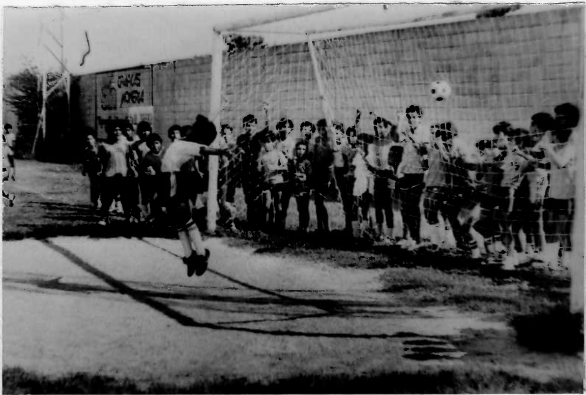
LA TENSION DE LA PENA MAXIMA