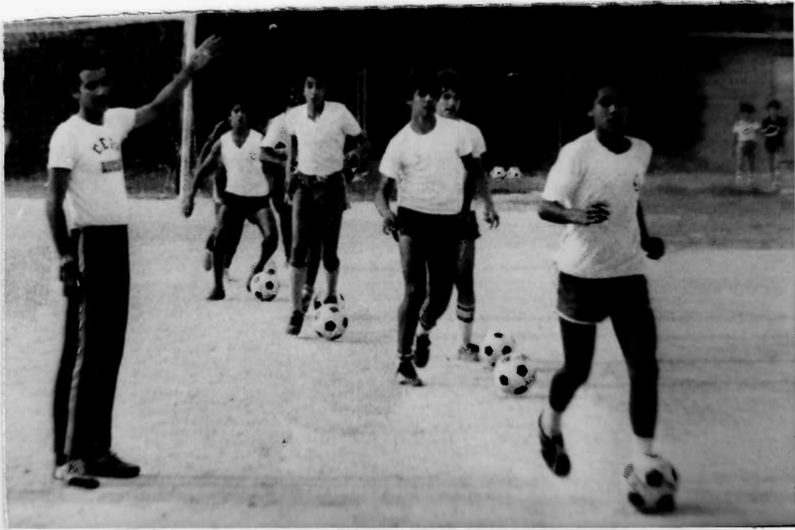
EN PLENA PREPARACION TECNICA LOS INFANTILES Y JUVENILES DE ARAGUA