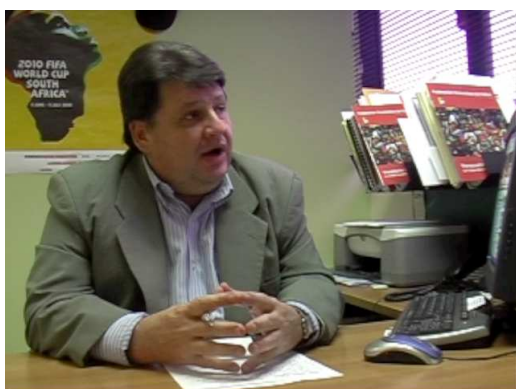
Entrevistados en la izquierda.