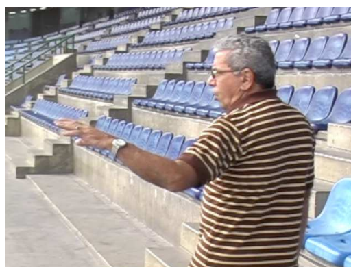
Entrevistados en exteriores.

En las entrevistas grabadas en exteriores se utilizarán, además, planos americanos y planos secuencias. Como se ven en los ejemplos de abajo: