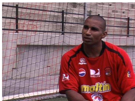
Entrevistados en la derecha.

En las entrevistas grabadas en exteriores se utilizarán, además, planos americanos y planos secuencias. Como se ven en los ejemplos de abajo: